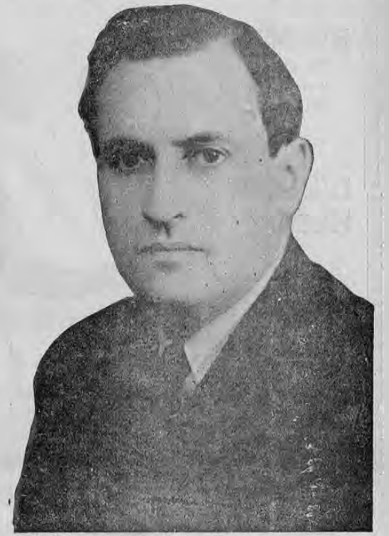
DR. DON RAFAEL ANGEL CALDERON GUARDIA

DIJO EN EL DISCURSO PRONUNCIADO ANTE UNA MAGNA REUNION EN EL VECINO CANTON DE MORAVIA, EL ILUSTRE EX PRESIDENTE DE LA REPUBLICA, DOCTOR DON RAFAEL ANGEL CALDERON GUARDIA