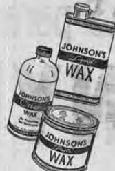
CERA JOHNSON'S, en pasta o líquida, para pisos de madera, mosaico, linóleo, muebles y artículos de madera.

Los pisos de su casa juegan papel importantísimo en el lucimiento de sus muebles... y por esto ellos deben estar siempre limpios y pulidos.