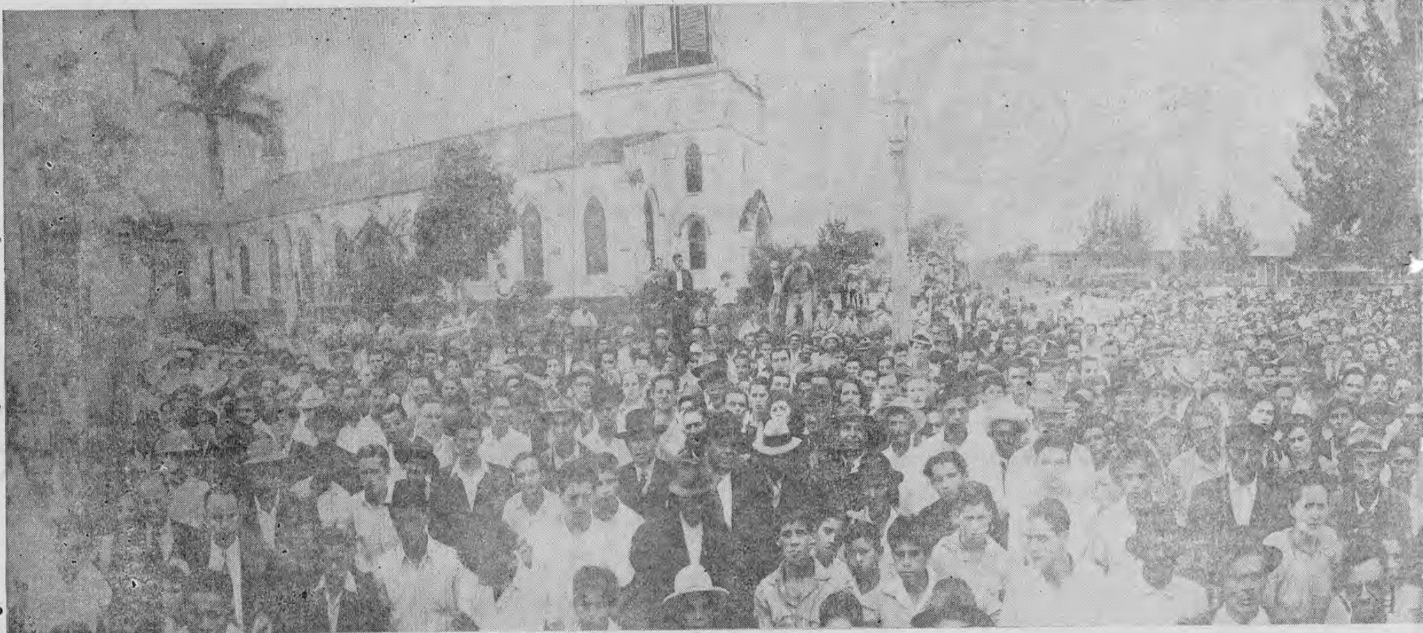
Aquí está la demostración del rotundo éxito del domingo en San Vicente de Moravia. Esta es la reunión cantonal calderonista. Sin movilizaciones, sin concen

Una vez más el calderonismo demostró el domingo que cuenta con fuerzas suficientes en todos los cantones del país para celebrar reuniones cantonales, que el derrotado ulatismo no puede arriesgarse sino a hacer concentraciones